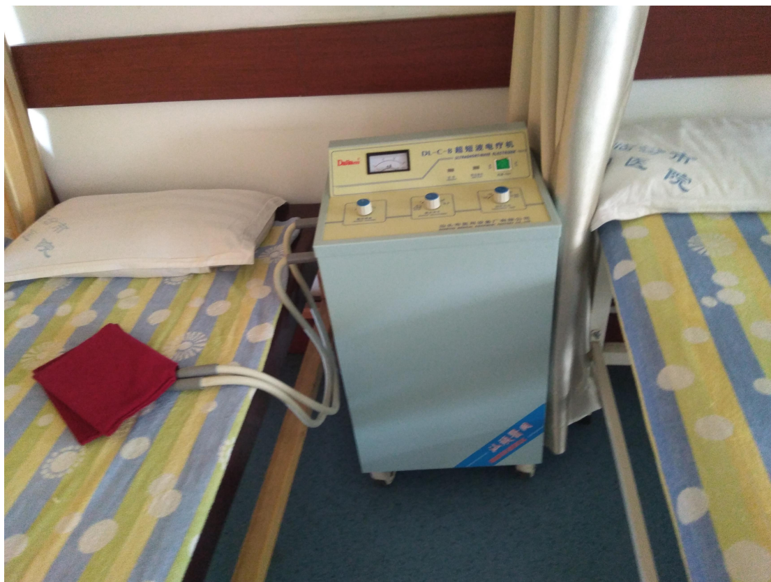
(康复设备-超短波电疗机)