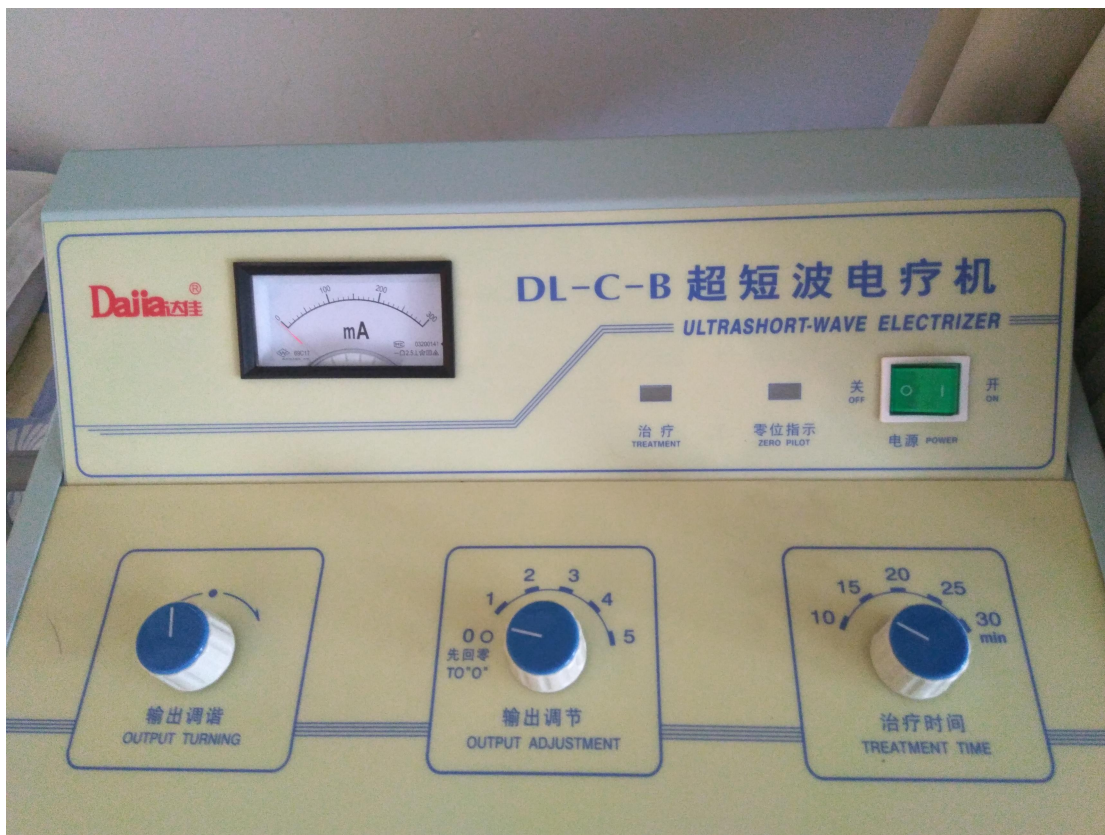
(康复设备-超短波电疗机)