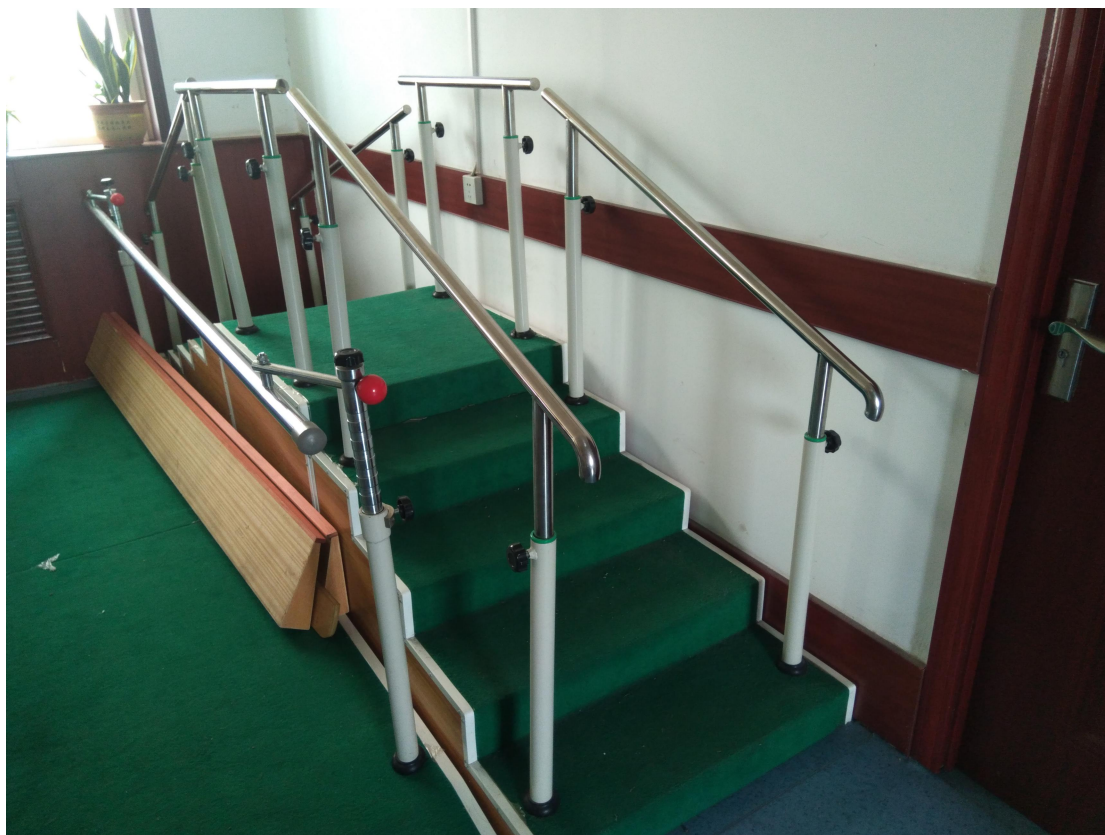
(康复设备-训练用阶梯双向)