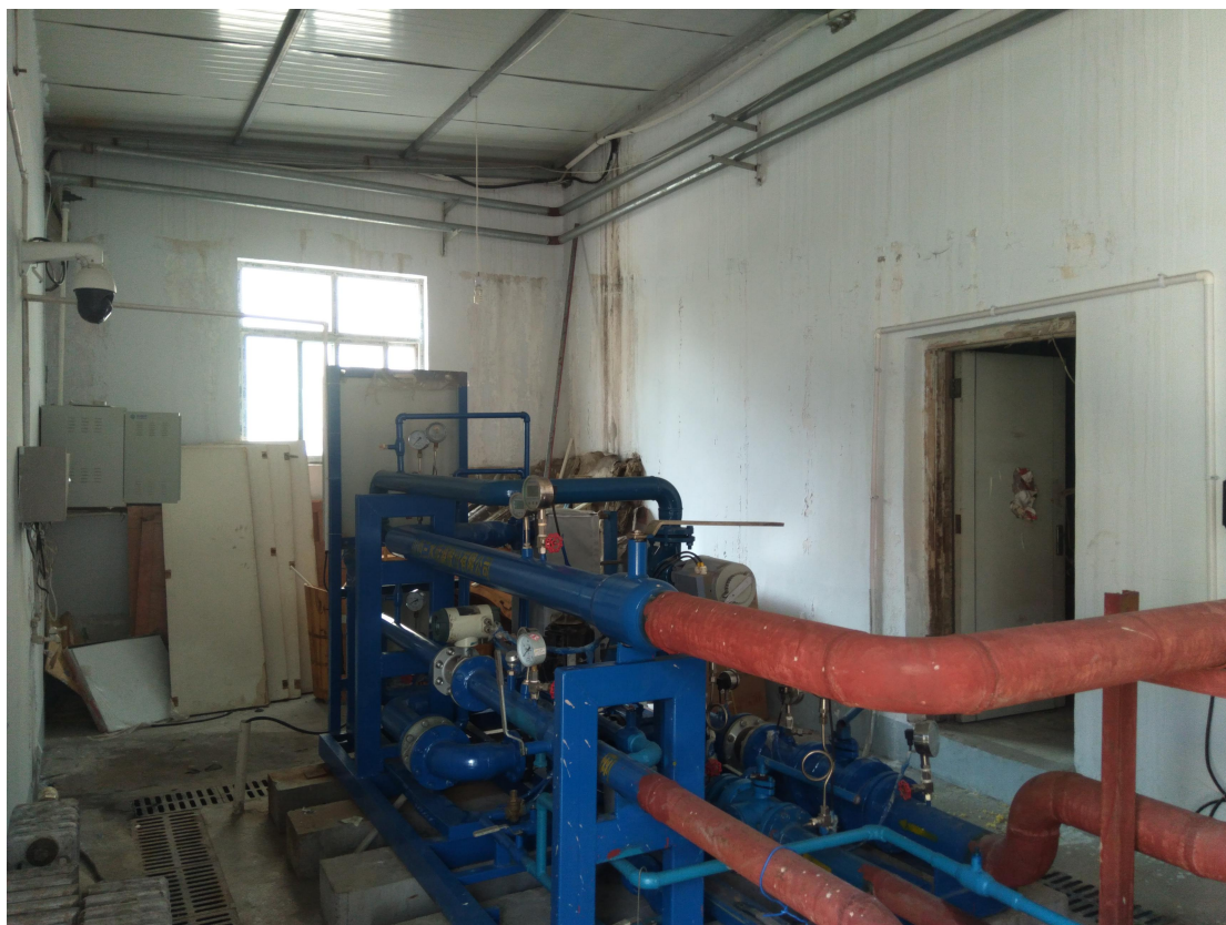
(新建彩钢房及大暖加压工程)