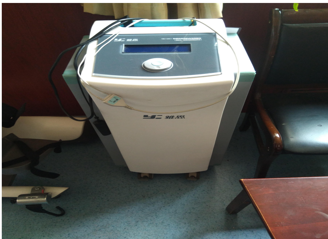
(康复设备-吞咽神经和肌肉电刺激仪)