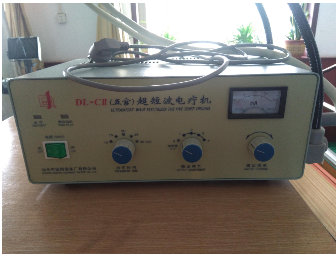
(康复设备-五官超短波电疗机)