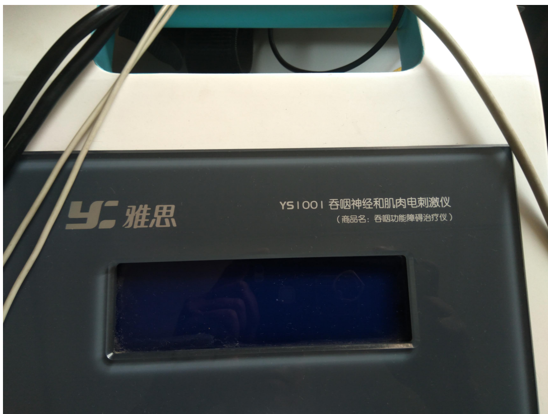
(康复设备-吞咽神经和肌肉电刺激仪)