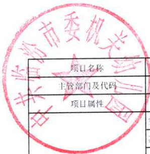
山西省省级预算部门（单位）项目支出绩效目标申报表 (2022年度)